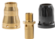
Contact tip adapters

Kemppis originalkontaktmunstycken säkerställer en optimerad överföring av svetsströmmen till tillsatsmaterialet. Kemppis kontaktmunstycken finns för alla tillsatsmaterial i de vanligaste storlekarna från 0,6 till 1,6 mm. Finns även i större diametrar upp till 3,2 mm.