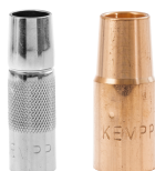
MIG/MAG gas nozzles

Pistolhalsen leder den elektriska strömmen till kontaktmunstycket tillsammans med skyddsgasen och kylvätskan. Du kan förlänga svetspistolens livslängd genom att byta ut dess hals.